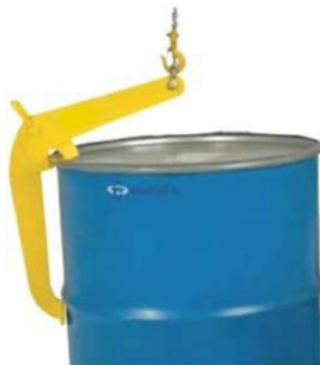
Рисунок 2. Работа захвата