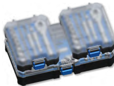
Наборы инструмента в среднем кейсе Z-БОКС 2