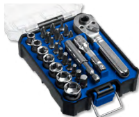
Наборы инструмента в малом кейсе Z-БОКС 1